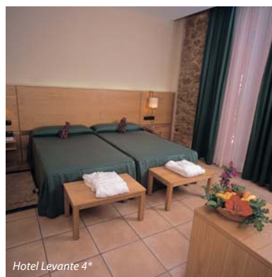
Hotel Levante 4*

TODOS LOS PRECIOS INCLUYEN acceso a PISCINASTERMALIMUM (ver descripción).