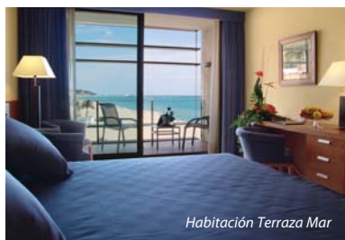
Habitación Terraza Mar

Actividades con monitores y charlas informativas según programa semanal, acceso a la piscina interior de agua de mar y climatizada (chorros jet y chorros Niágara, chorros cisne, camas y sillas de burbujas), piletta de inmersión, fuente de hielo, templo de duchas, camino de sensaciones mediterráneas, sauna, hammam, caldarium, jacuzzi de agua termal, gimnasio, sala de aeróbic y zona de relax. Préstamo de albornoz, toalla y gorro de piscina.